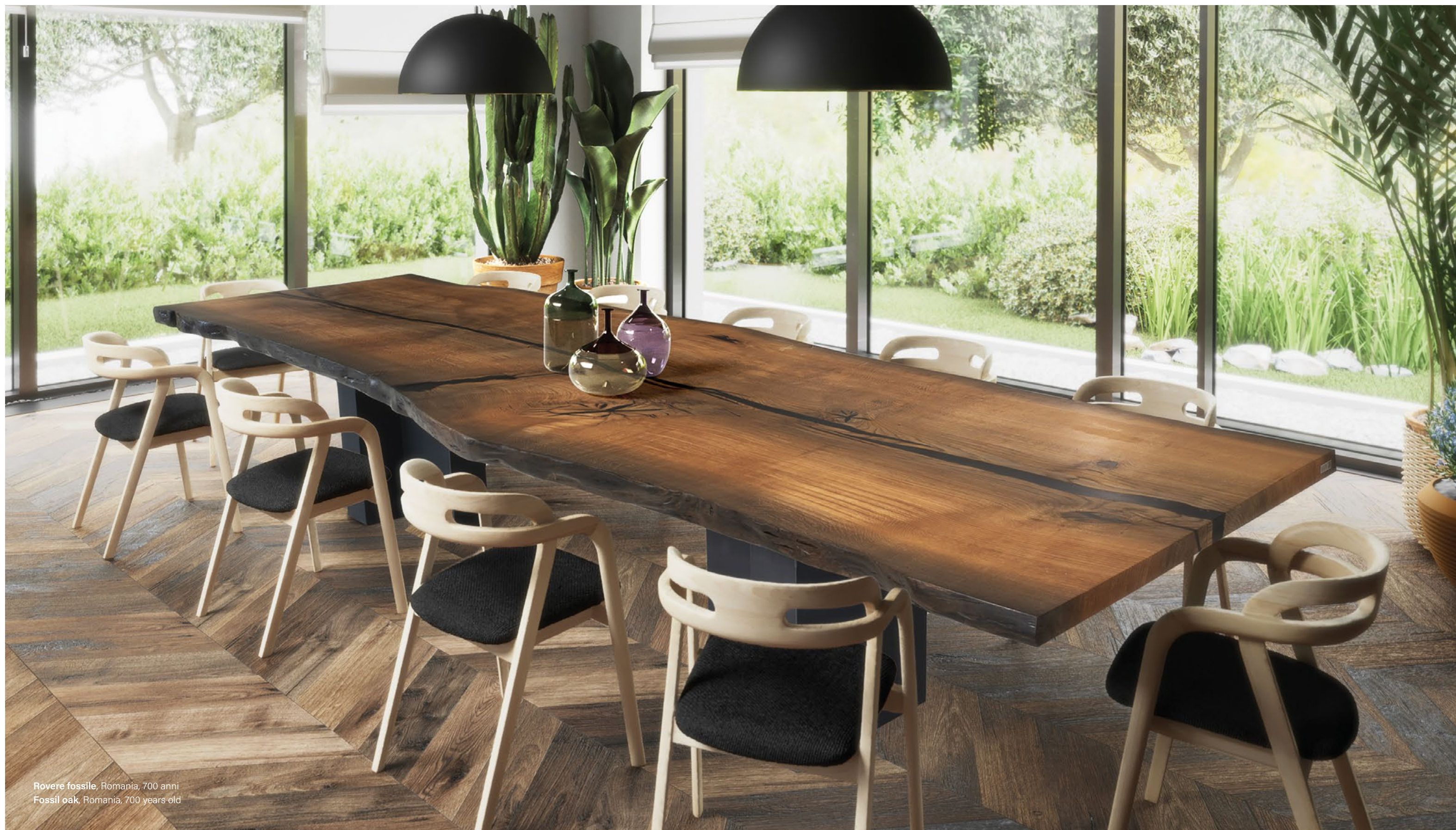
Rovere fossile, Romania, 700 anni Fossil oak, Romania, 700 years old