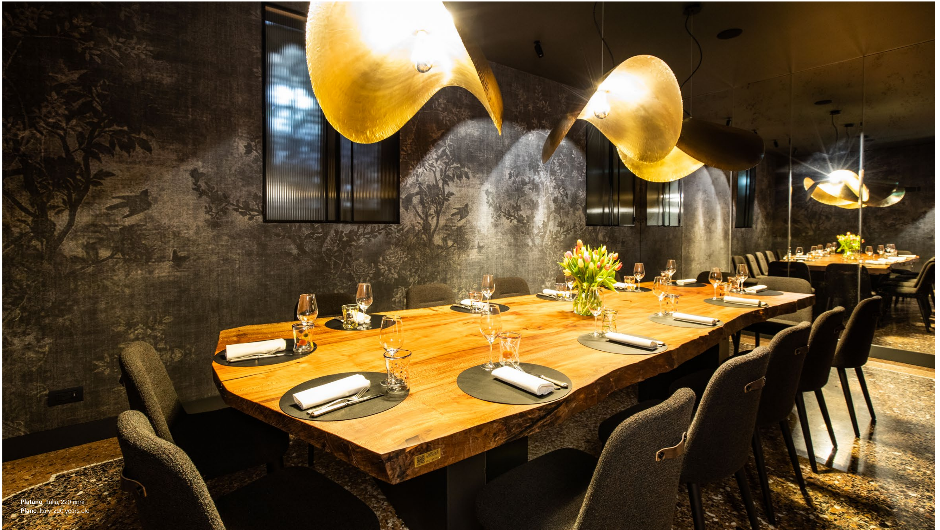
Platano, Italia, 220 anni Plane, Italy, 220 years old