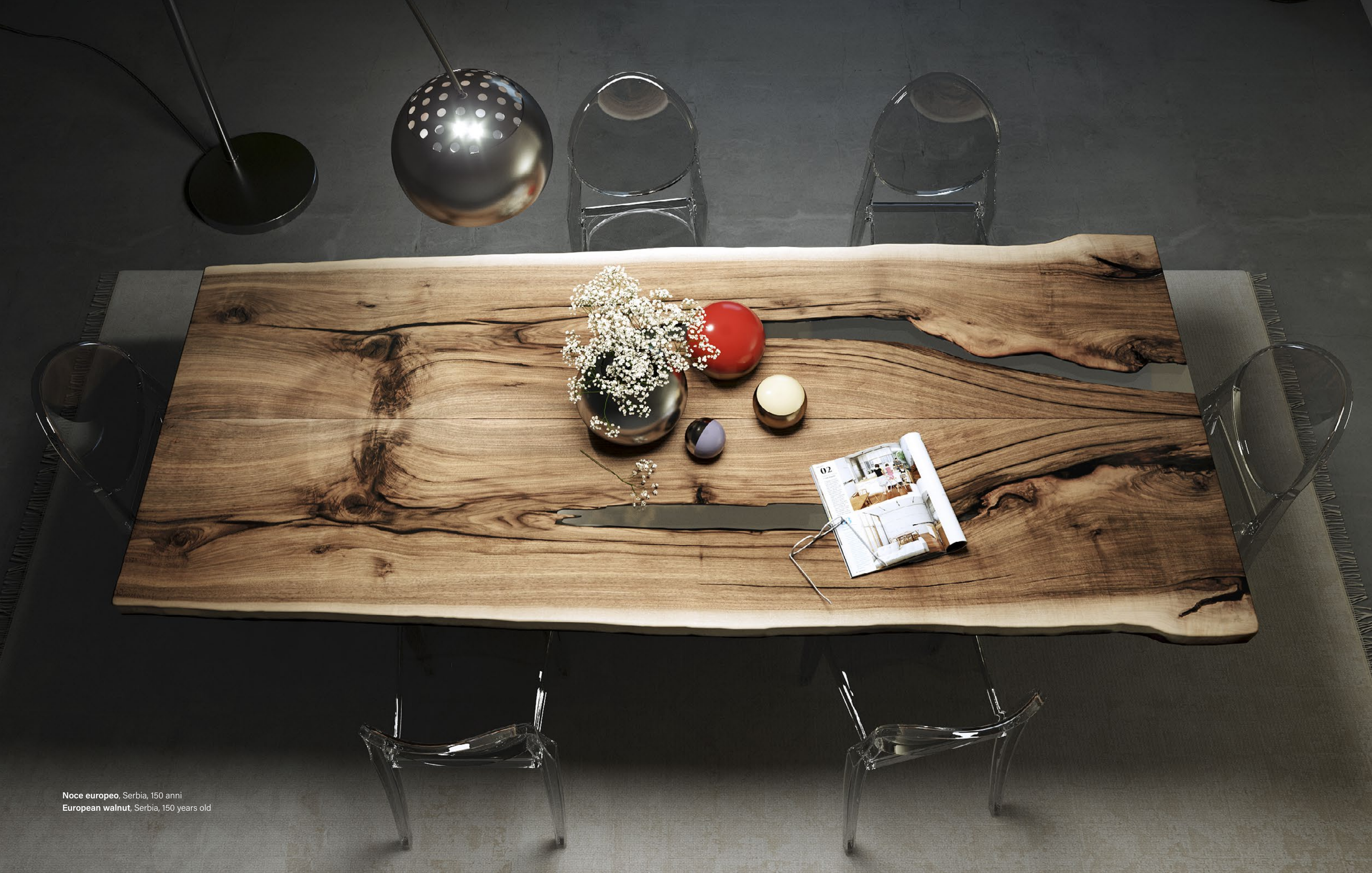
Noce europeo, Serbia, 150 anni European walnut, Serbia, 150 years old