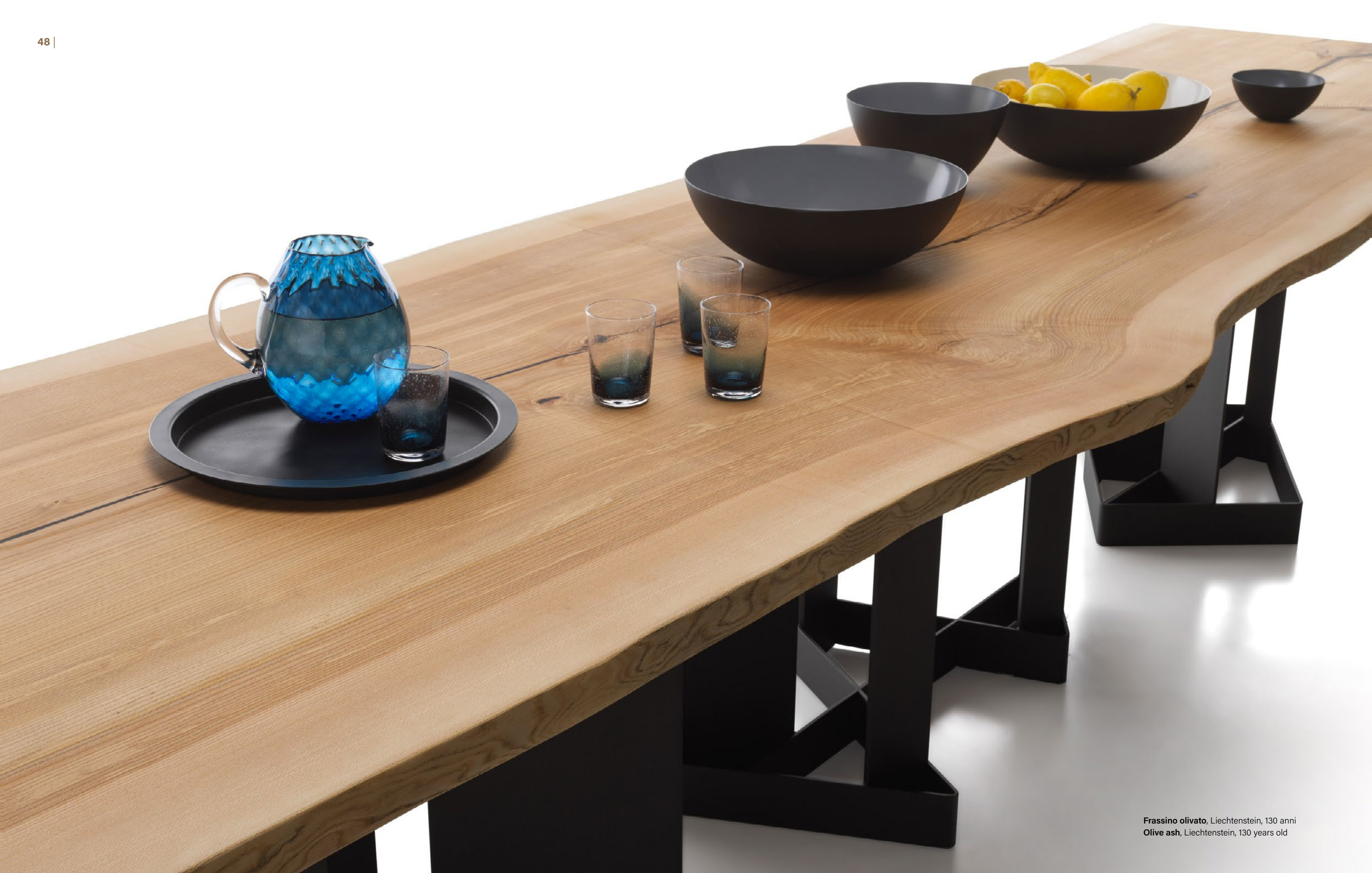
Frassino olivato, Liechtenstein, 130 anni Olive ash, Liechtenstein, 130 years old