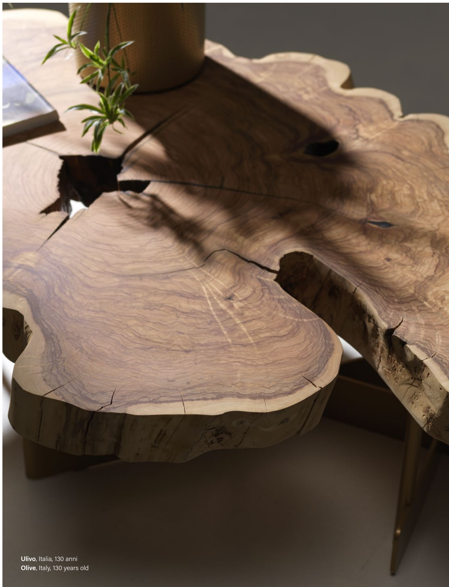
Ulivo, Italia, 130 anni Olive, Italy, 130 years old