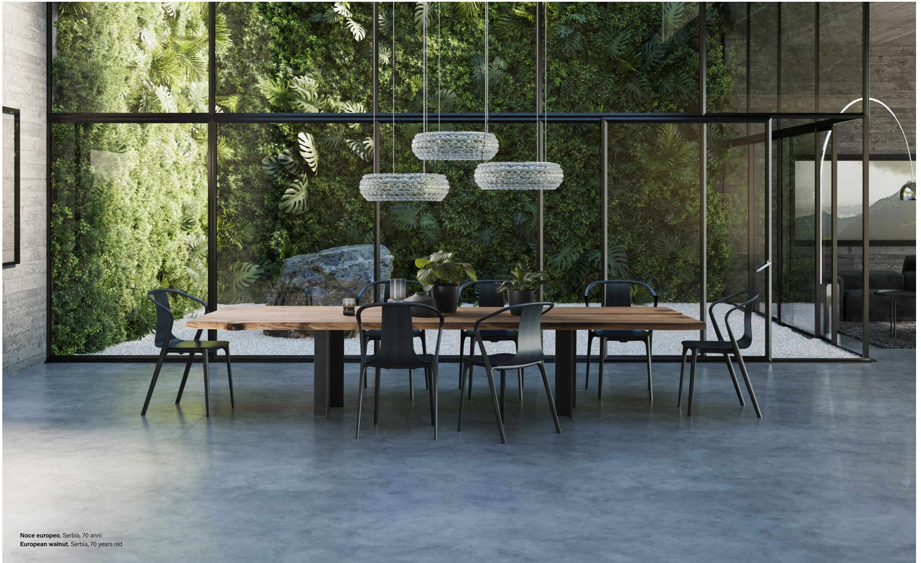
Noce europeo, Serbia, 70 anni European walnut, Serbia, 70 years old