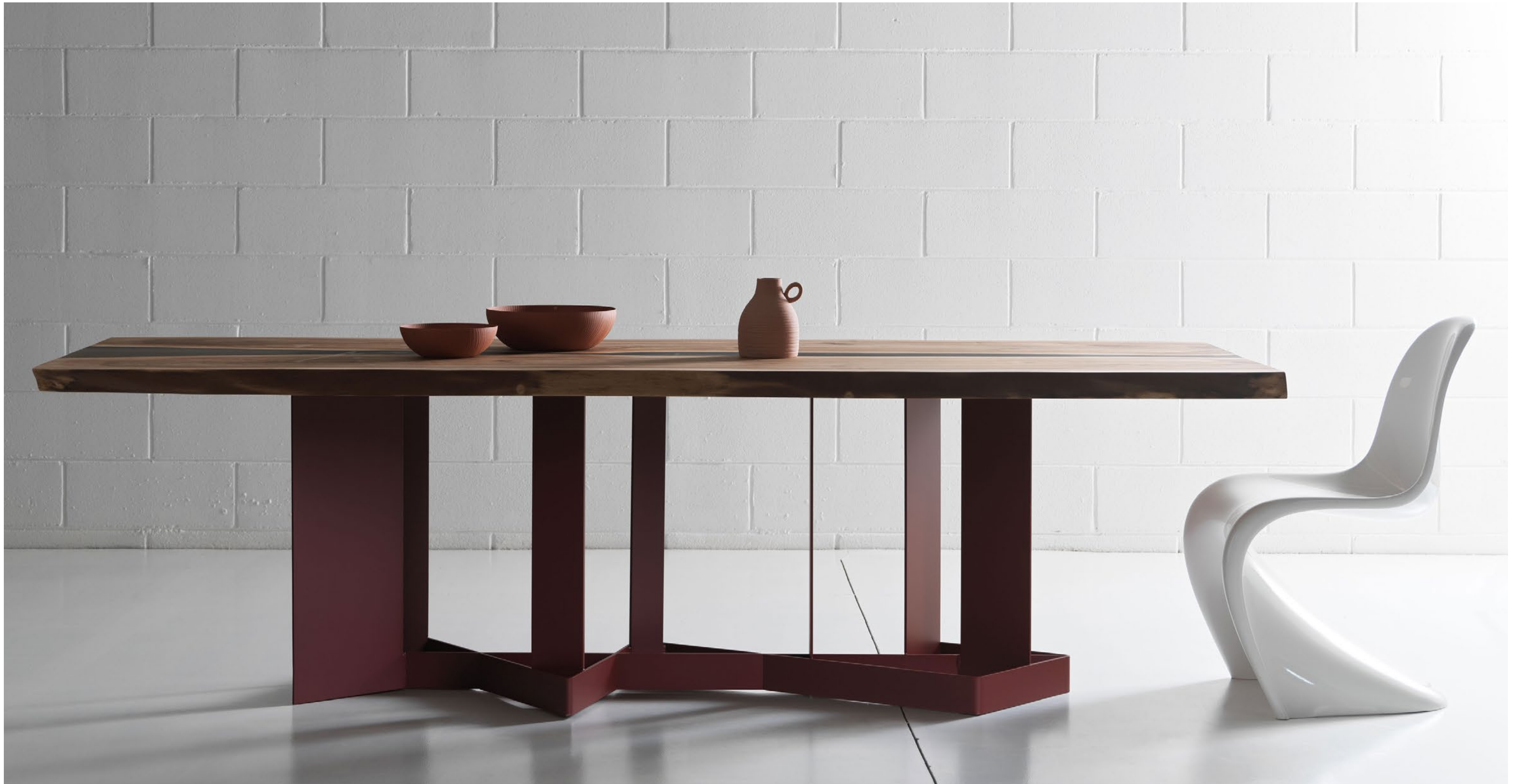
Noce europeo , Serbia, 70 anni European walnut , Serbia, 70 years old