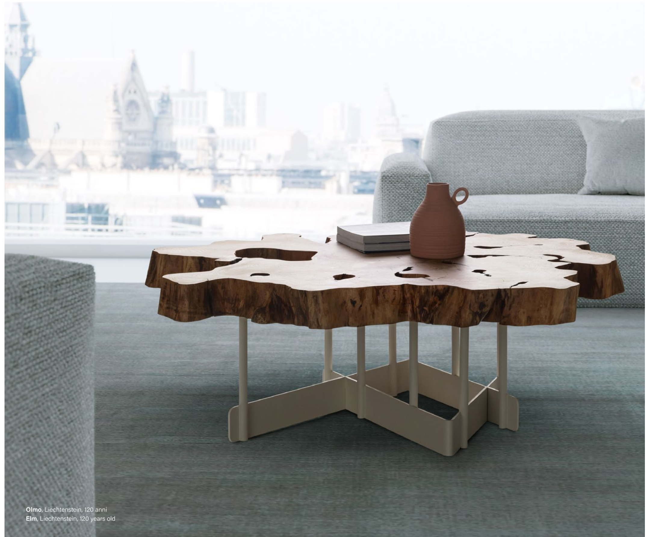
Olmo, Liechtenstein, 120 anni Elm, Liechtenstein, 120 years old

In addition, we offer our customers the freedom to choose among our collection bases or opt for bespoke solutions, thus each table is an authentic expression of their style and preferences.