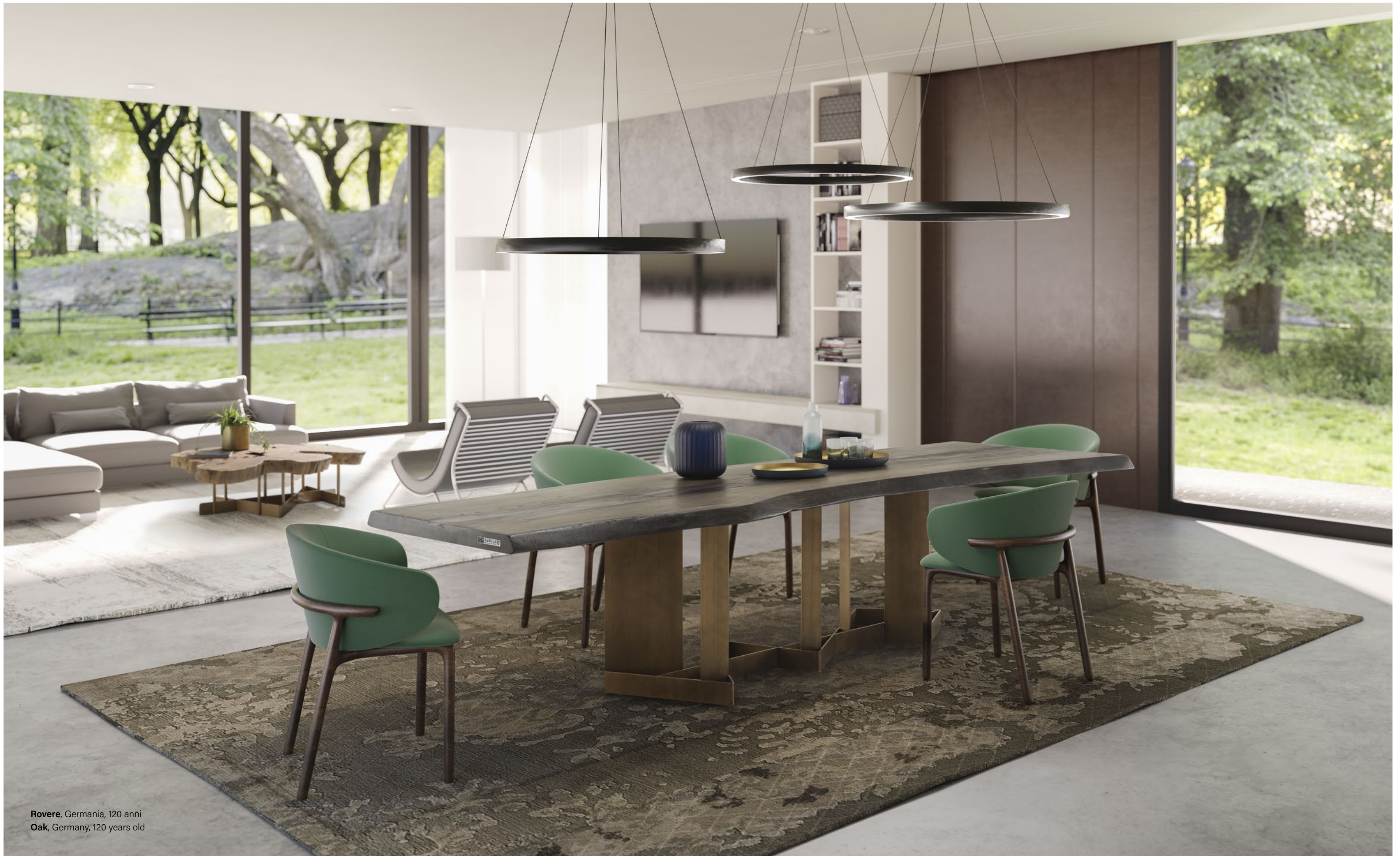
Rovere , Germania, 120 anni Oak , Germany, 120 years old