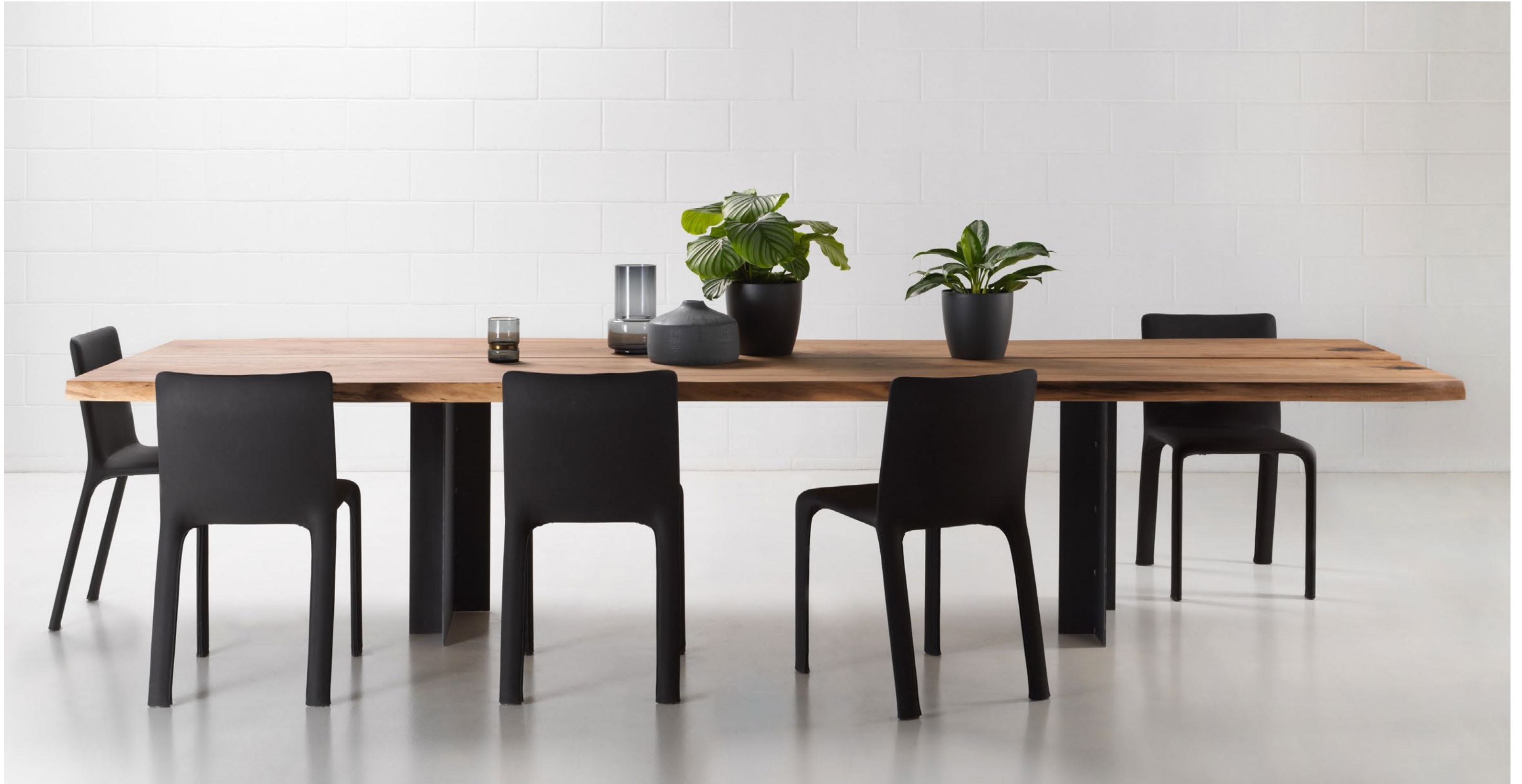
Noce europeo , Slovenia, 80 anni European walnut , Slovenia, 80 years old